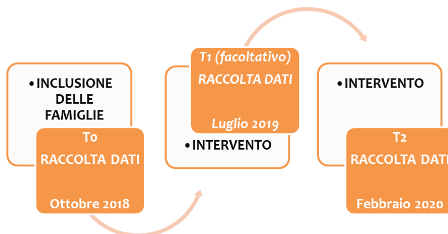
Figura 2. Il disegno della valutazione di P.I.P.P.I. (EEMM-famiglie)

Nei due periodi che intercorrono tra la prima e la seconda rilevazione (tra T 0 e T 1 ) e tra la seconda e l'ultima (tra T 1 e T 2 ), gli operatori attuano i dispositivi previsti sulla base delle azioni sperimentali definite nei momenti di rilevazione precedente (T 0 e T 1 ).