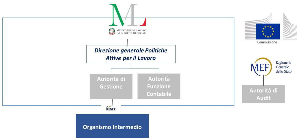
Figura 1: INAPP come Organismo Intermedio del PN GDL 4

Per assolvere agli impegni assunti in convenzione, l'Istituto propone il proprio assetto organizzativo che tiene conto delle molteplici responsabilità funzionali facenti capo ad INAPP sia in qualità di OI che in qualità di beneficiario delle Operazioni individuate nel Piano di Attuazione approvato dall'AdG, assicurando l'adeguata separazione tra le stesse, in osservanza a quanto previsto agli Artt. 71 e 74 del Reg. 1060/2021.