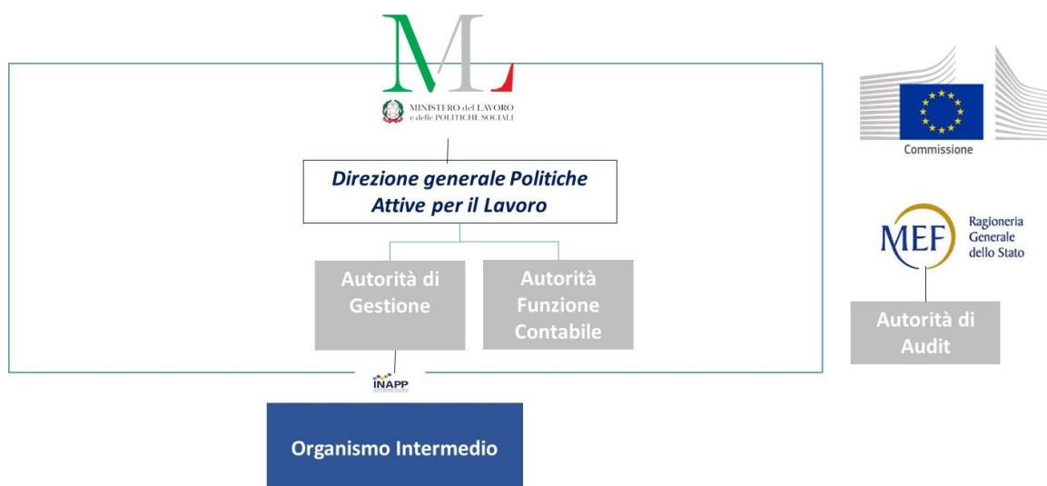
Figura 1: INAPP come Organismo Intermedio del PN GDL 4

Per assolvere agli impegni assunti in convenzione, l'Istituto propone il proprio assetto organizzativo che tiene conto delle molteplici responsabilità funzionali facenti capo ad INAPP sia in qualità di OI che in qualità di beneficiario delle Operazioni individuate nel Piano di Attuazione approvato dall'AdG, assicurando l'adeguata separazione tra le stesse, in osservanza a quanto previsto agli Artt. 71 e 74 del Reg. 1060/2021.